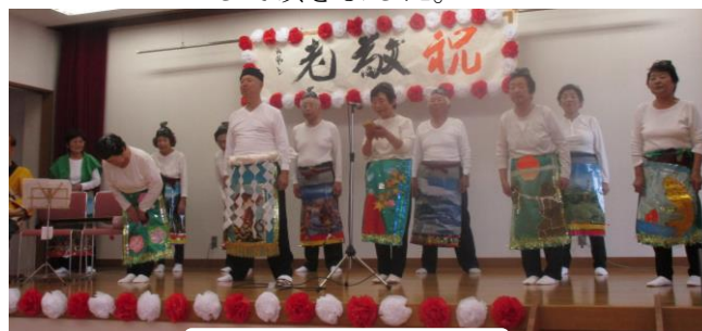
演芸披露「片縄民謡会」