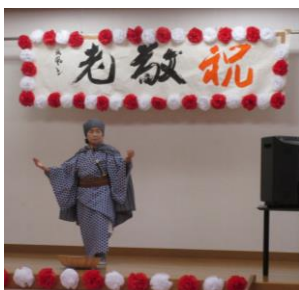
演舞披露「番場の忠太郎」

来場者の皆さんにくじ引きをしていただき、当たった番号毎にプレゼント！健康体操・演芸披露・のど自慢大会・・・そして、毎年恒例の「片縄民謡会」の方たちによる各地のご当地民謡！来場者の方たちも一緒に、「歌って」「踊って」、楽しいひと時を過ごして頂きました。