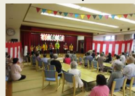
写真は昨年の様子です

お楽しみイベント 盛り沢山！ お誘い合せの上、たくさんの皆様のご利用お待ちしております。