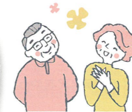
◀オレンジカフェ「りんご」の様子