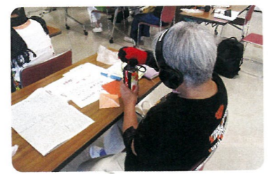
▲ミニ体験セット着用の様子

また、ふくし教育サポーターとして活動することを想定し、全身用の高齢者疑似体験セットの装着手順や児童への声かけ等を学んでもらいました。参加者のみなさんからは、「相手の気持ちを考えた声掛けの大切さを学んだ」、「養成講座で学んだことで、不安なく、ふくし教育サポーターとして活動できる」等のご感想をいただきました。