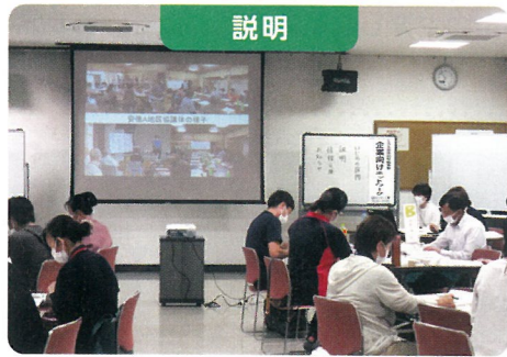
企業向けネットワークの必要性や協議体の活動について説明を行いました。