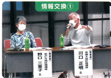
第2層協議体に参加されている地域住民さんから、地域の様子について発表していただきました。