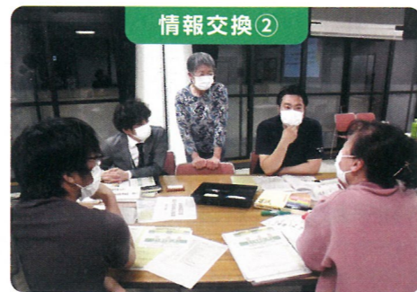
協議体との協働活動についてアイデア出しを行いました。