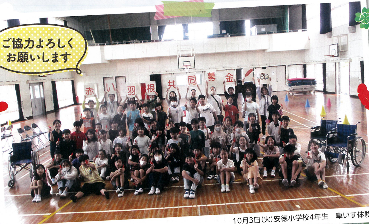
10月3日(火)安徳小学校4年生 車いす体験

社会福祉法人 那珂川市社会福祉協議会 〒811-1242 福岡県那珂川市西隈1丁目1-2 那珂川市福祉センター TEL(092)952-4565 FAX(092)952-7321 Mail n-shakyo@dream.ocn.ne.jp