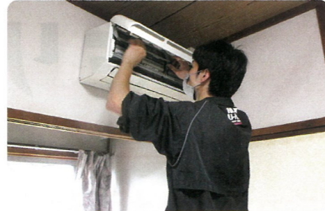
▲生活支援サポーター「ニコニコお助け隊」