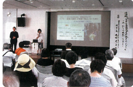
▲第19回 地域福祉を考えるつどい