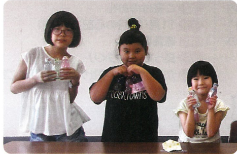
▲夏休みたけのクラブ

赤い羽根共同募金は、高齢者・しょうがい者・子どもたちなどへの、地域の福祉活動を支援する募金です。地域福祉を推進する社会福祉協議会で行う事業では、皆さまからご協力いただいた募金を財源として、福祉事業を実施しています。