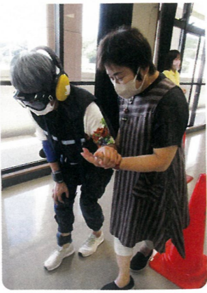
▲全身用高齢者疑似体験セット着用の様子

社会福祉協議会では、学校とともに子どもの学びや育ちを支え、「ともに生きる力」をはぐむ福祉教育を推進しています。福祉教育の体験学習では、地域の方々に子ども達の見守りや声掛け等のご協力をお願いしています。ご興味がある方は、お気軽に下記までお問い合わせください。