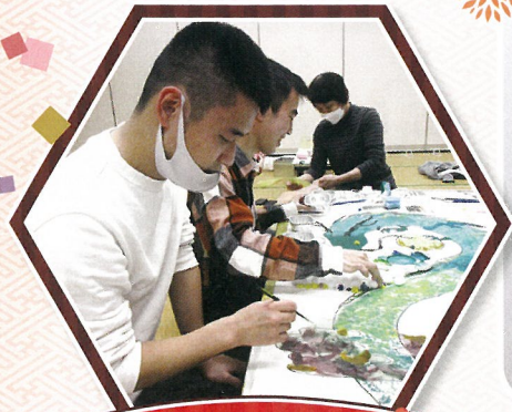
バンブーカフェ 事業