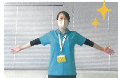
▲肩回りの健康体操をご紹介