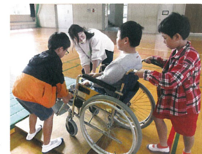
岩戸小学校4年生車椅子体験の様子