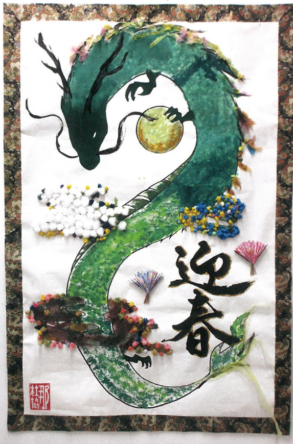
笑って健康づくりに参加された皆さん バンブーカフェ事業に参加された皆さん 那珂川市社会福祉協議会デイサービスのご利用者様