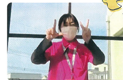
▲チョキを入れ替える体操をご紹介