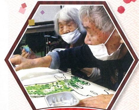
那珂川市社会福祉協議会 デイサービス