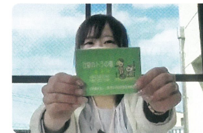
▲社協トラの巻きをご紹介

那珂川市社会福祉協議会職員が「社会福祉協議会について」や「脳トレ体操」などを紹介しています!ぜひご覧ください!