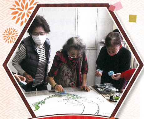
笑って 健康づくり