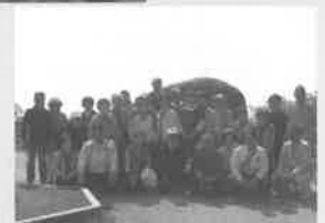
五郎丸区ふれあいサロン(バスハイク)