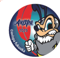
アビー コラボバッジ