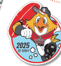
ハリーホーク コラボバッジ