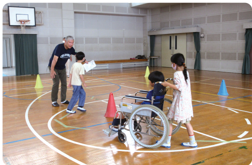
▲小学校での福祉教育の様子

子ども達が福祉教育を体験、学習し、自分たちの住んでいるまちには、障がいのある方や、高齢の方など、支援を必要としている人たちがいることに気づき、気持ちを理解し、たすけあう気持ちを育むことが、だれもが安心して住み続けられる地域づくりにつながっています。